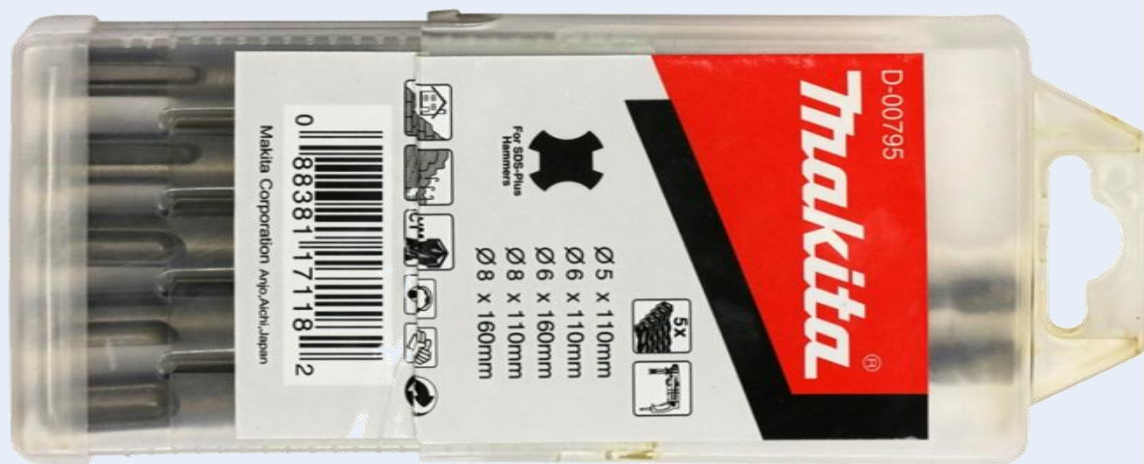
Набор буров из комплектации X5