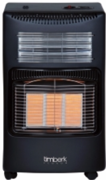
На рисунке: модель TGH 4200 M2