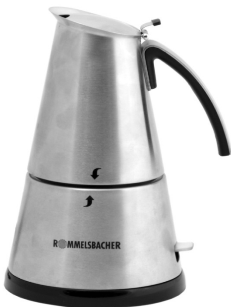
EKO 364/E EKO 366/E